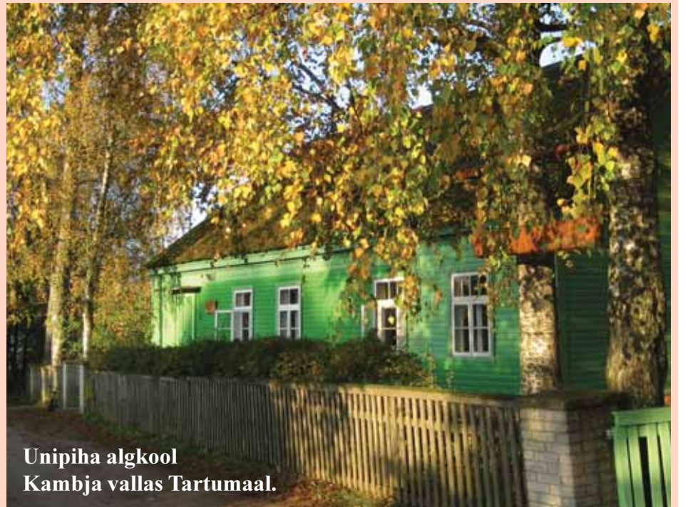
Unipiha algkool Kambja vallas Tartumaal.