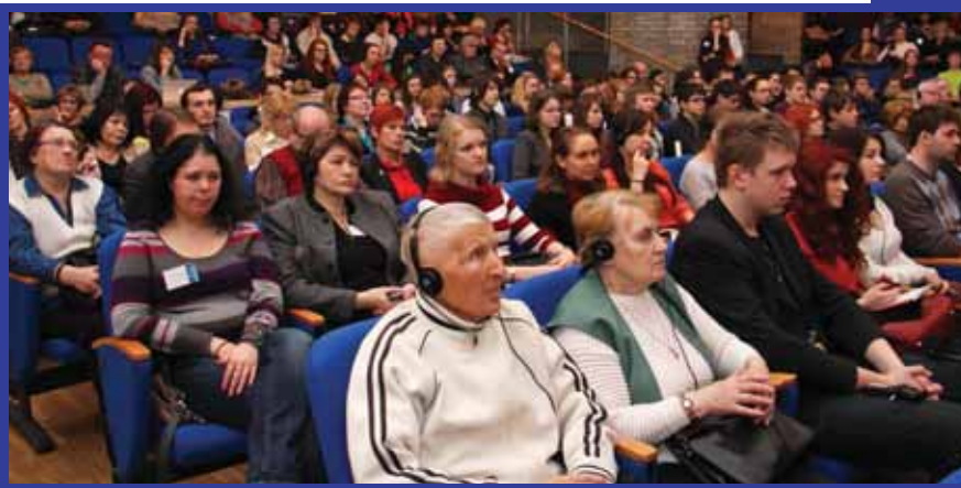
SUUR HUVI: Kodurahufoorumile tuli põnevaid ettekandeid kuulama nii noori kui ka vanu erinevatest rahvastest inimesi.