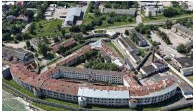
VAADE PATAREILE LINNULENNULT: Patarei kindlus Tallinnas on stiilipuhtana säilinud klassitsistlik kaitserajatis, mis kuulub Euroopa ehituspärandisse. Ühtlasi on Patarei näol tegemist kommunismi ja natsismi ohvrite mälestusmärgiga ning Eesti Vabariigi märtrite vastupanu võimsa sümboliga.

1. jaanuaril 2005 likvideeriti Patarei vangla ja see hoone anti üle Riigi Kinnisvara Aktsiaseltsile (RKV AS). Kuigi katus oli juba vangla likvideerimisel kehvast seisusest, oli seda aastaid püütud lappida ja enam-vähem pidas see vihma. RKV AS pole aga 12 aasta jooksul katust parandanud, vaid on ainult otsinud ulmelisi raken-