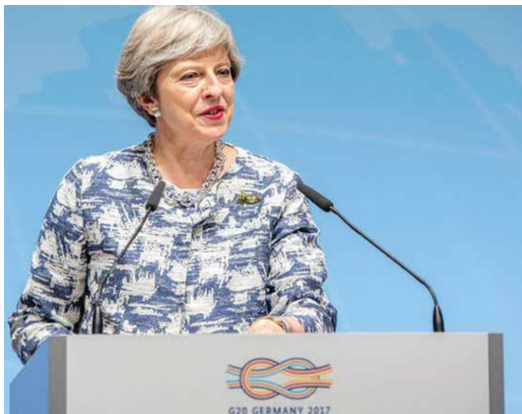
MAY MÄÄRAMATUS: Kuigi Briti peaminister on jätkuvalt Theresa May, on selgusetus tuleviku ees ühiskonnas väga suur.

Konservatiivide poole hoidev samuti suur väljaanne The Daily Telegraph (1. juuli 2017) püüab aga välja tuua Brexiti positiivseid jooni. Nii kirjutatakse selles, et pikas perspektiivis on