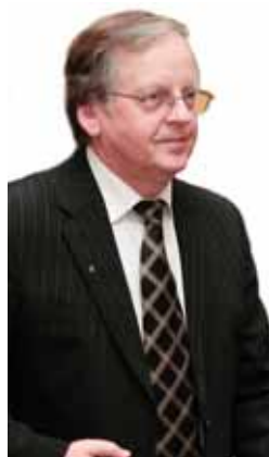
EENN EESMAA Riigikogu väliskomisjoni aseesimees

Kui uskumatu äziotaaž „Ühtse Eesti“ poliititeatri ümber hakkas tuure koguma, märkasim toimuvas ootamatuid paralleele Leedu erakonna Rahvusliku Taassünni Partei väleda tõusu ja niisama kiire häbbumise. Vahe on vaid selles, et Leedus asutasid erakonna tippmeelalahutajad ja mõned üldriiklikult tunnustatud kultuuritegelased, meil aga oli aktsioon ja püüne peal üks ja kindlasti mitte kõige mõjuvõimsam teater.