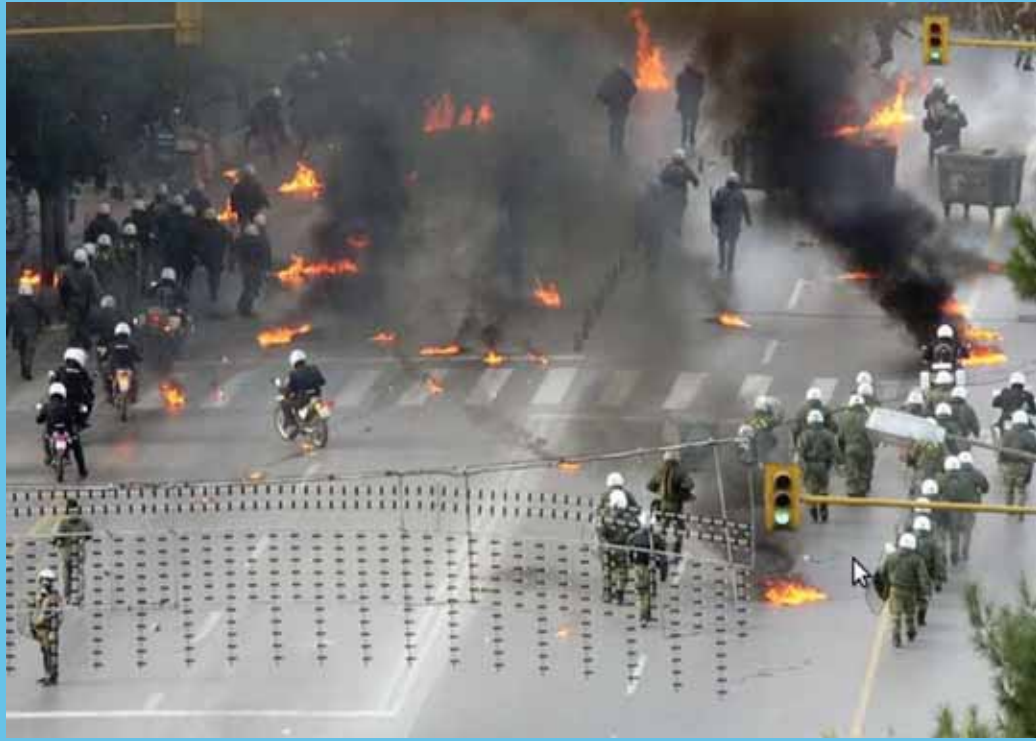
TÄNAVALAHINGUD: Mitmendat nädalat kaitsevad kreeklased tänavatel oma heaolu. Rahutused on juba nõudnud mitu inimest.

2009. aasta 1. jaanuaril eurotsooni pääsemise eufooria on Slovakkias kiiresti üle läinud. Kuigi loodeti, nagu aitaks euro sisseviimine tõsiselt võidelda kriisiga, on tulemused osutunud pigem vastupidiseks. Ekspordi mahu, välisinvestorite rohkuse ja SKP kasvu poolest liidriks olnud Slovakkia on muutunud liidriks