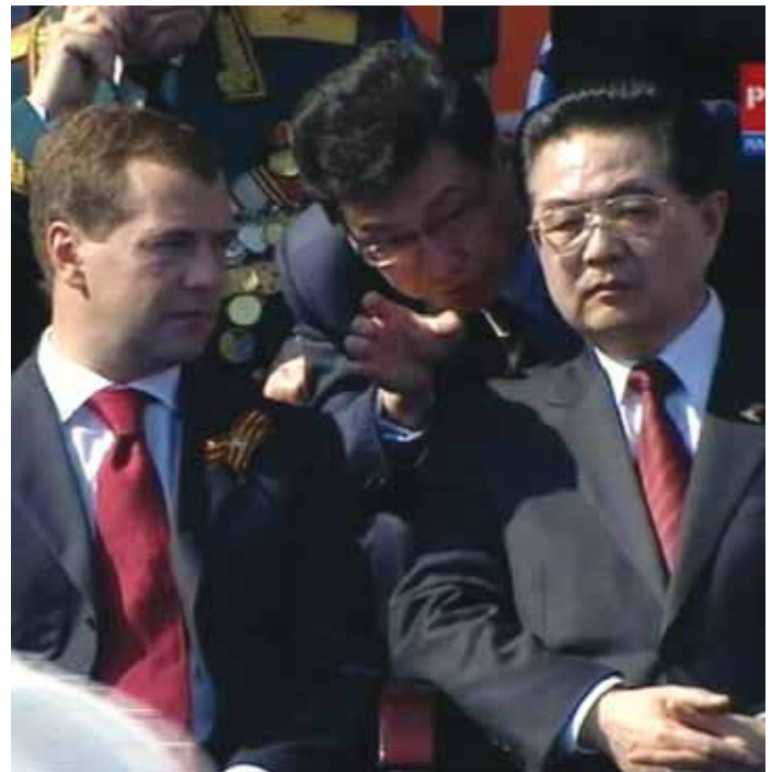
SUURED: Medvedev, Vene president, ja Jintao, Hiina president.