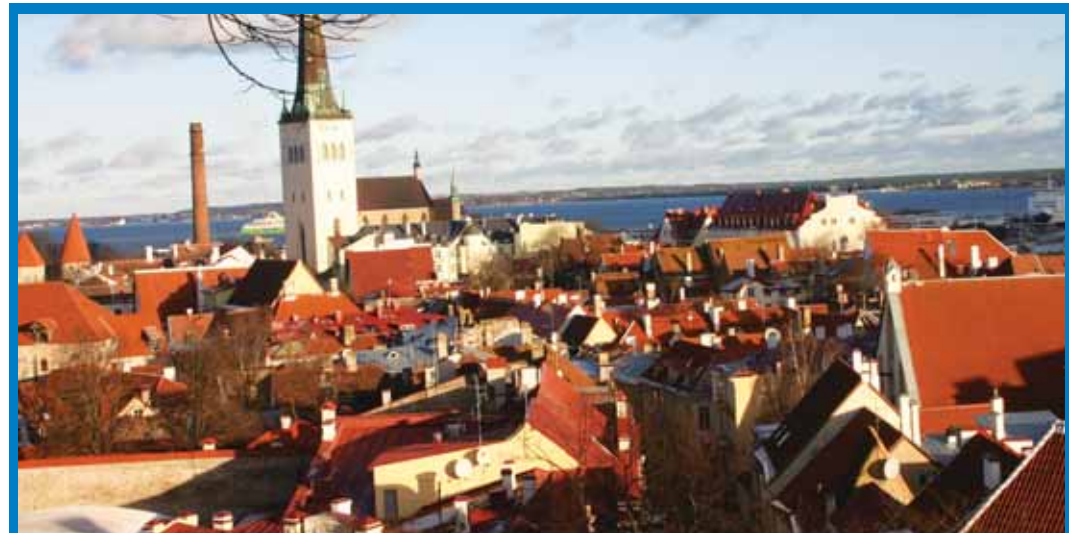
HÄSTI JUHITUD PEALINN: Ainult Keskerakonna valimisplatvormis 2013 oli Levaldi sõnul esitatud vajadus kindlustada kohalikele omavalitsustele kvaliteetne juhtimissüsteem, kaasates selle väljatöötamise kõiki omavalitsustöötajaid ja arvestades kohalikke iseärasusi.

Juhtimise täiustamine kvaliteetjuhtimissüsteemide loomise ja rakendamise kaudu põhineb ajaloolise kogemuse üldistamisel ega ole kiiresti-mööduv moevool. Paljudes maades, sealhulgas Soomes, on see protsess riiklikult korraldatud ning kvaliteetne juhtimissüsteem on muutunud normiks. See võimaldab neil edukalt kasutada juhtimissüsteemide edasise täiustamise meetodeid. Keskerakonna suundumus kohalike omavalitsuste kvaliteetjuhtimissüsteemide väljatöötamisele ja rakendamisele annab tunnistust sellest, et tema juhtimisel muutub Eesti haldussüsteemi eesmärgiks järjest enam kogu rahva vajaduste rahuldamine ja järjest enam piiratakse võimu taotlevate kildkondade kitsaste huvide saavutamise võimalusi.