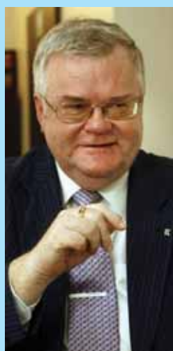
Keskerakonna esimees ja Tallinna linnapea Edgar Savisaar 18. jaanuaril Keskerakonna volikogul.

„Suurimaks euroteemaks on kiirraudtee rajamine Tallinnast Kaunasesse. Enne kui hilja, tuleks püüda utopia asemel selle rahaga kaasajastada kasvõi terves pikkuses elektriraudteena Tallinn–Tartu–Valga ja Tallinn–Narva suunad. Miks mitte taastada ka reisirongiühendus Tallinn–Haapsalu. Kõike seda tuleks meil teha Eesti arenguks ka siis, kui EL-i fondidest sentigi ei tilgu. Rail Baltic’ut edasi pressides on tulemuseks, et me ei saa korda oma sisemisi ühendusi ega ühendusi naabritega. Kiirrongi Berliini ei tule aga niikuinii, sest puudub vajadus. Nii valus kui see ka ei ole just praegusel kujul Rail Baltic’u projektiga end sidunud Siim Kallasele ja Juhan Partsi, tuleb püüda see raharong suunata Eestile vajalikele rööbastele.“