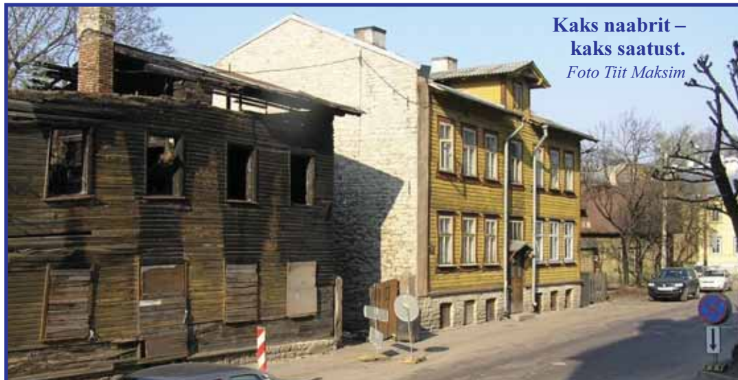
Kaks naabrit – kaks saatust.

küladest oleks inimesed ära küüditatud ja hooned seetõttu tühjaks jäänud ning lagunema hakanud. Paraku on seda „küüditamist“ teostanud meie armas Eesti Vabariigi valitsus. Pidevalt toimub üks töökohtade ja inimeste koondamine ja töötuks jätmine. Tööd ei jõua üüri maksta ja tõstetakse tänavale. Seda aitab teostada tänapäeval ka Inkasso.