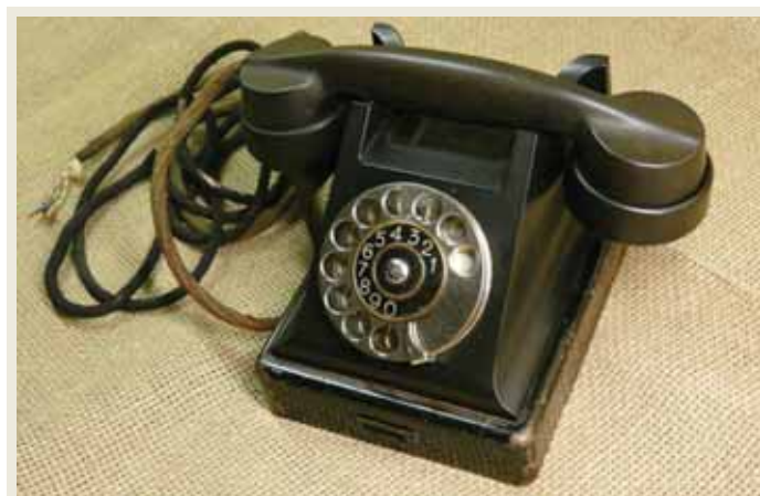
KÖNETRAADIAPARAAT: Küllap levinuim näide Tartu Telefonivabriku üllatavalt mitmekesisest toodangust.

Taotlesin algul Eesti ametkonnadelt (Majandus- ja Kommunikatsiooniministeerium, Tarbijaa-