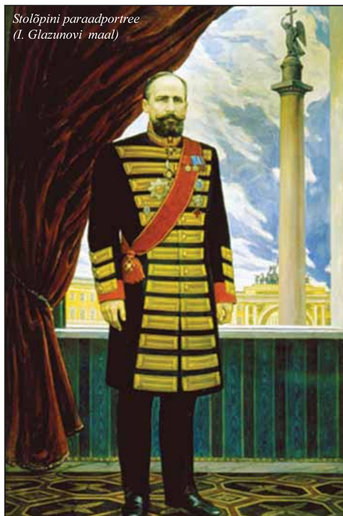
Stolõpini paraadportree (I. Glazunovi maal)

Milliseid riiklikke ümberkorraldusi oli Stolõpin soovinud läbi viia? Näiteks omavalitsustasandil oleks tulnud rakendada tööõnnetuskindlustus, haigushüvitised, vanaduspension. Kõige olulisemaks pidi saama aga valitsuse agrarpoliitilise kursi muutmine – Stolõpin nägi ette, et põllumajandussektorist tõuseb esiplaanile tugev ja jõukas talupoeg (kulak), aga arhailine kogukondlik talupoeg surutakse kõrvale. Kõik soovijad said õiguse osta endale maad. Loodi võimalused Kesk-Venemaa kitsastest oludest, kus põllumajandust ahistas maapuudus, ümber asuda Siberisse, Kesk-Aasiasse, Kaug-Itta jm. Säärast agrarpoliitikat juba saatiski tohutu edu. Statistika näitab, et 1915. aasta lõpuks oli Venes saanud maaomanikuks 25–50% talupoegkonnast. Ostu-müügi tegevuses aitas kaasa selleks