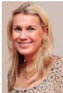
KADRI SIMSON Keskerakonna parlamendifraktsiooni esimees

27. septembril andis peaminister Andrus Ansip Riigikogule üle 2013. aasta riigieelarve ning opositsioonil on olnud võimalik selle mahuka dokumendiga tõsiselt tutvuda.