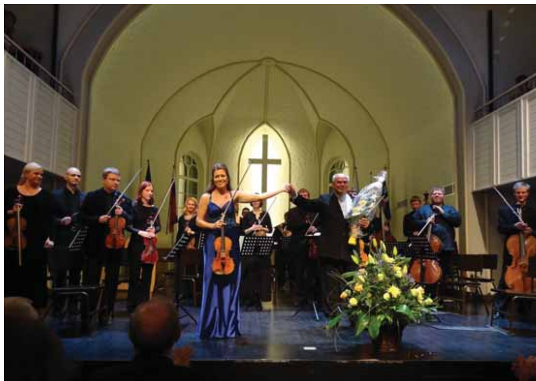
TÕMBAB: Kahe linna koostööna taasvalminud eesti-luteri koguduse Jaani kirik tõmbab järjest rohkem eestlaste turismi Peterburi suunas. Pildil esineb ses kirikus Tallinna Filharmoonia kammerorkester – seesama, millele kultuuriminister Rein Lang keeldus raha andmast.