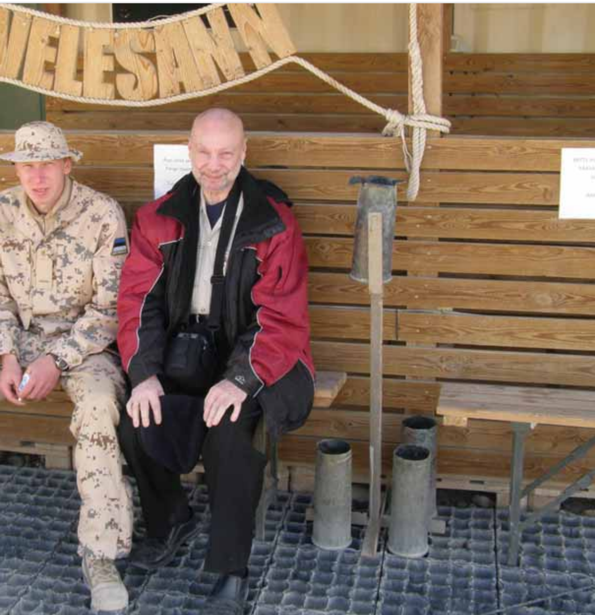
Afganistanis asuvas Helmandi provintsis on õhutamperatuur kõrge, leiab Velesann sõdurilt tihedat