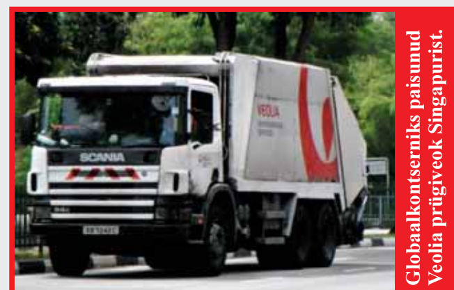
Globaalkontserniks paisunud Veolia prügiveok Singapuris.

Mul on Hiiumaal Käina vallas Kassaris mõtteline osa Pärna kinnistust, mida külastan vaid kord aastas – tänavu juunis viibisin seal paar tundi. Mul ei ole Veoliaga lepingulist vahe-korda ega pole mul seal ka prügikonteinerit. Vaatamata sellele esitati mulle 11-eurone prügiveoarve. Olen seda neile kolm korda tagastanud koos eestikeelse kaaskirjaga, millest arusaamine näib Veolias raskusi valmistavat.