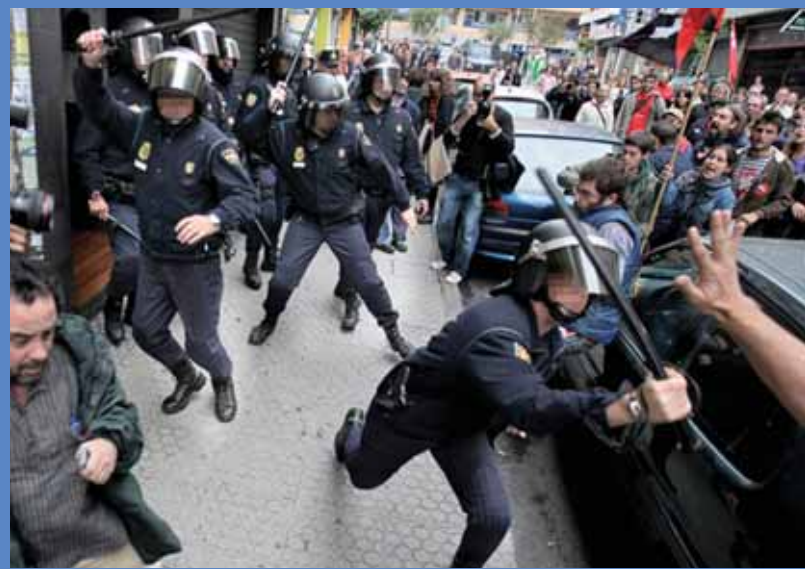
MIS VAHE ON OKTOOBRIREVOLUTSIOONIGA? Praeguses Euroopas on pilt selge – mida lõuna poole, seda suuremad on sotsiaalsed lõhed ja rahva mässumeelsus. Fotol rahutused Hispaanias sügisel 2010.

Inimkonna ajalugu on katastroofide ajalugu. Mõnikord on neist õpitud. See on raske, kuid mitte võimatu.