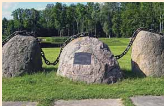
Need kolm rahnu Kärus (Rapla maakond) põlis-tavad 23. augustil 1989 Balti riikide vabaduspüüdlusi kehastanud inimketi üle aegade, sest inimesed on ajalikul, aga kivid igavesed.

Viljandi suunale meie ei jõudnud, vaid enne Karksi-Nuiat suunati meid Lätimaa poole. Teedel olid ummikud. Sõitsime edasi, kuni peatasime bussid siis, kui oli aeg seista ketis.