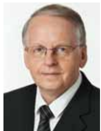
ENN EESMAA Keskerakonna aseesimees, Riigikogu liige

Rooma paavsti iga-aastane läkitus soovustega oma elu väärikamalt elada on oluline sadadele miljonitele katoliiklastele, sest selle läkituse kaudu usuvad nad kuulvat Jumala häält. Seda läkitust loevad ja kommenteerivad ka need, kellele see otseselt pole adresseeritud. Needki, kes usuteemade suhtes leiged või lausa skeptilised.