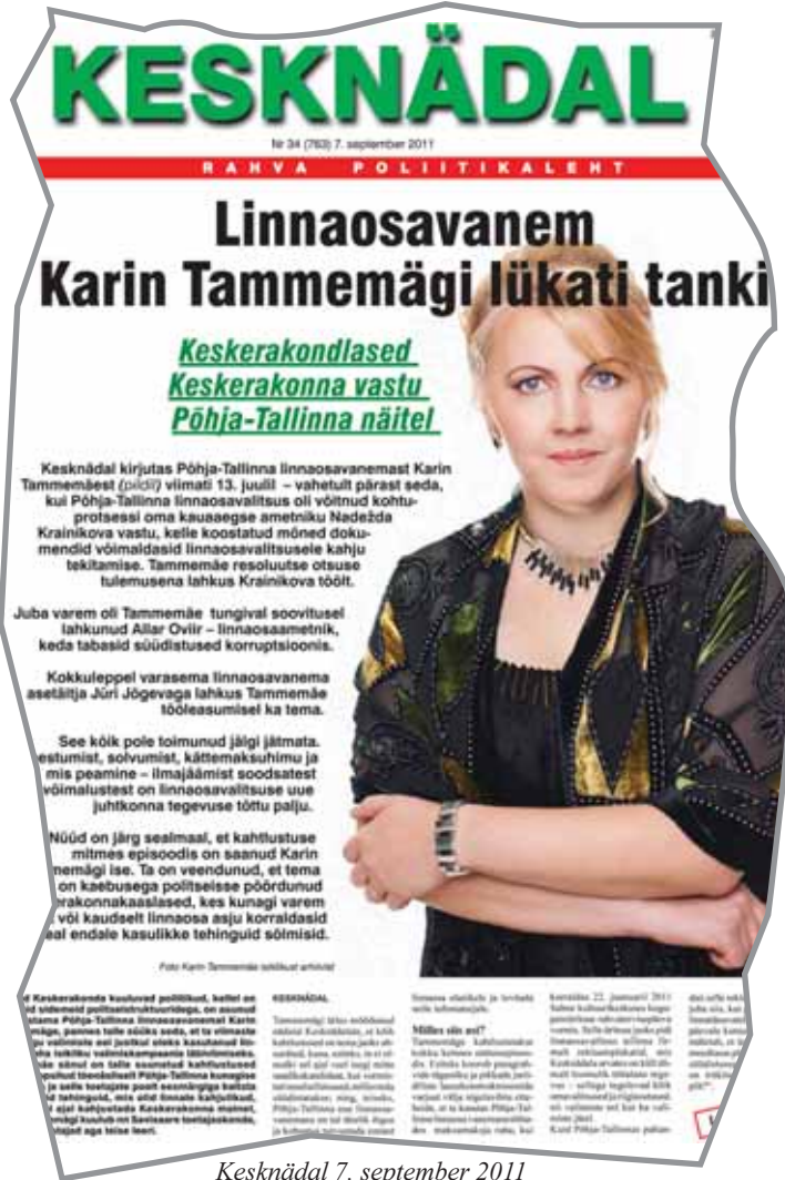
Kesknädal 7. september 2011