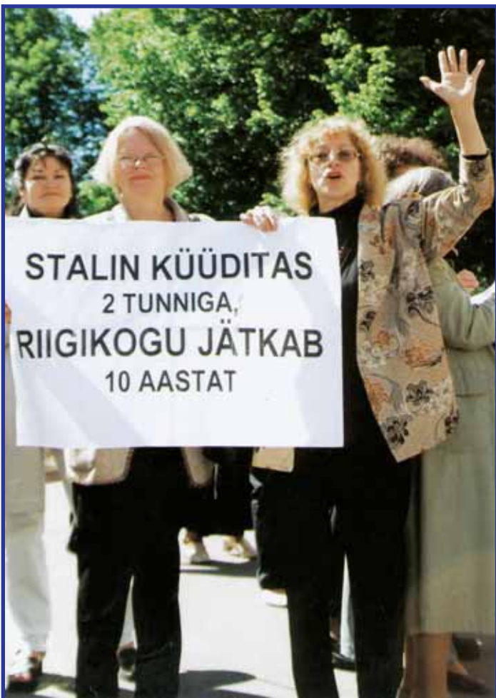
VÄSIMATU VÕITLUS: 1990ndatel käisid sundüürnikuks tehtud kodanikud-valijad-maksumaksjad tihti Toompea lossiplatsil poliitikutele Eesti Vabariigis tehtud ülekohtu meelde tuletamas.

koostöö, mis algas Majandus- ja Kommunikatsiooniministeeriumi eestvõttel 2005. aastal. Kokku tuli eluaseme- strateegia koostamise juht- grupp, mis tõi välja valdkonna prioriteetid ja arutas võimalikke lahendusi. Tunnistati, et tagastatud majade üürnike probleemi lahendamine, sotsiaalsetele riskirühmadele munitsipaal-üüri-alamispinda- de võimaldamine jm teravad elumajanduslikud proble- mid on pälvinud suhteliselt vähest tähelepanu. Seetõttu toodi prioriteetselt toetatava sihtgrupina uues arengukavas välja sundüürnikud jt omandi- reformiga oma eluruumi eras- tamise õigusest jäänud üürnikud. Uus arengukava nägi aastaks 2010 ette sund- üürnike kindlustamise eluase- mega, sh omandireformist tekkinud materiaalse kahju hüvitamise. Selle meetme maksumuseks kuni 2010. aastani prognoositi peaaegu 550 miljonit krooni. Kui Keske- rakond oli viimati koalitsioonis, esitas ta kahel korral valit- susse eelnimetatud elumu- majanduse arengukava ja sel- lega ka sundüürnike probleemi lahendamise põhisuuna. Kuid Reformierakond blokeeris need mõlemal korral, hooli- mata sellest, et koalitsiooni- lepingus olid põhimõtted kokku lepitud.