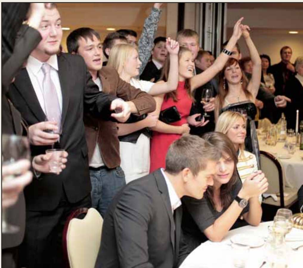
NOORED HOOS: Kesknõored valimispeol pärast kohalike valimisi 2009. a Tallinnas, kus volikogu kohtadest võideti absoluutne enamus.

Soovin, et meie ühiskonnas toimuks rohkem arutelusid noorte ja nende elus esile tulevate probleemide ümber. Et noortele suunatud