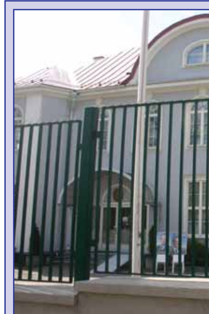
OOTUSÄREVUSES: Prantsusmaa raamatukogu taga Toomkuninga kampaaniat – algul olid saatkondade kandidaatide portreed, lõpuks Hollandi ja Nicolas Sarkozy. Prantsuslastele, kes hääletasid sotsialistlik kesklinn täituse taaskord ajaloo.