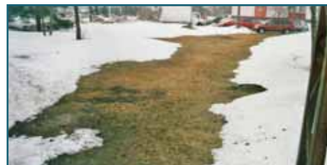
Kevad veel kaugel, aga "kõetavad peenrad" valmistuvad rohetuma ja võililleõide minema. Maapõuest hoovav soojus tekitab kõrvalolevale kõnni- ja sõiduteele lisalibedust – kinnitallatud lumi muutub jalakäijatele luumurdmist pakkuvaks jääks.

Hoolimata tänavusest rekordlumest võib Mustamäe kütetrassidel varsti kasvõi varaseid lilli korjata. Libedate kõnniteede asemel kasutatakse nüüd käimiseks sageli lumevabu trassipealseid. Keskuse tänavas on Mustamäe teest Ehitajate teeni koguni "kõetav trotuaar". See kuidagi ei haaku fossiilse kütuse kokkuhoiuga ega keskkonnakaitsega, ennem aitab kaasa "globaalse soojenemisele". Miskipärast ei usu, et keegi oleks tõsimeeli kokku arvestanud kalorihulki, mis kuluvad soojatrasside lumevabana hoidmiseks. Soojakadu kestab pidevalt - suvel kütab õhku soojaveearustus. Keegi peab koletu energiakao kinni maksma. Ega's ometi katlamajad või linna reservfond? Katlamajadel on kasulik uhada, mis torust tuleb. Peaasi et maksjaid oleks. Maksjaks on linnakodanik, kes võib igati koorderada sooja vee tarbimisega, ent korterimajade küttekulud ei sõltu enam temast - korruseid läbivad küttesüsteemid ei võimaldagi seda. Keevita või radikad välja,