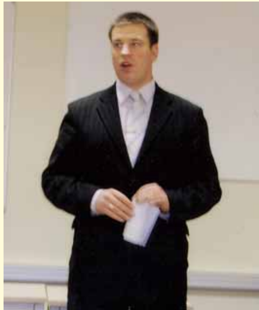
Riigikogu aseesimees Jüri Ratas kohtumas tartlastega Tartu Ülikooli raamatukogus.

Keskerakondlane Jüri Ratas, Riigikogu teine aseesimees, on seadnud endale eesmärgiks tutvuda kohapealse olukorraga, et osata vastu võtta elanike jaoks paremaid ja õiglasemaid otsuseid. Nii on ta tänaseks tutvunud olukorraga absoluutselt kõigis Eesti valdades; viimaseks oli Ülenurme Tartu lähistel. Jüri Ratas andis Ülenurme gümnaasiumi 11. klassis ühiskonnaõpetuse