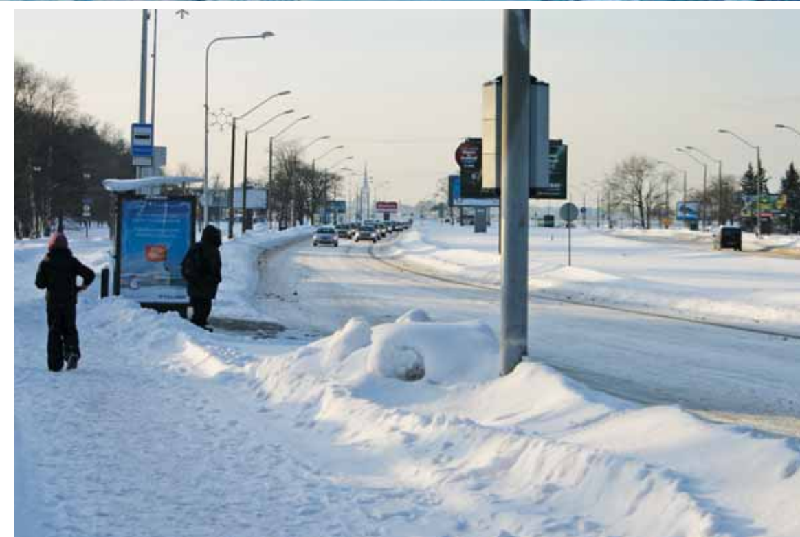
is Lauluväljaku juurde viib, oli enne 1980. aastat kogu Pirita tee! Seda mööda sõitsid mmikutest ei osatud undki näha. Parempoolsel pildil tänane uhke magistraal, mille