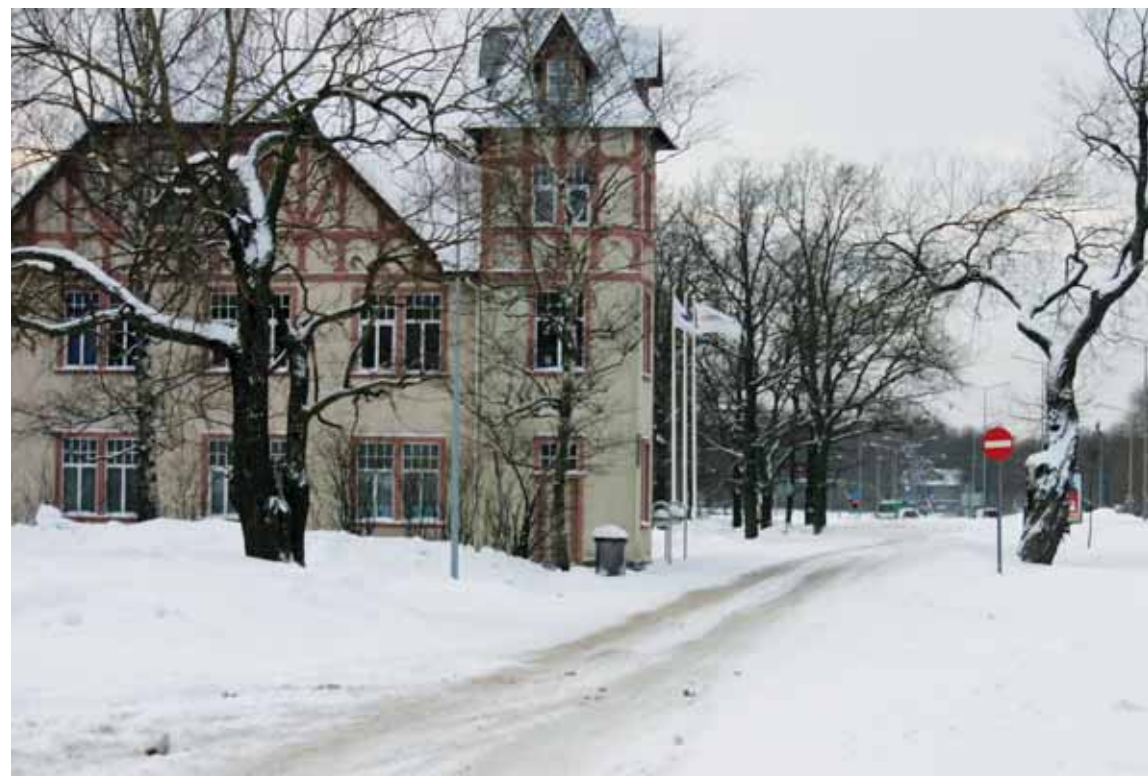
HARJUMUS JA UNUSTUS: Ega praegu ei usuksi, et vasakpoolsel pildil olev tee, mis on nüüd ühissõidukite jaoks, oli juba 1970. aastal kavandatud. Nüüd on see juba ühissõidukite jaoks, mida muidugi oli siis palju vähem, ja praegustest uueks ehitamiseks võeti merelt maad juurde.