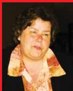
MAI TREIAL: Lihtne on valitseda koos järeleandjatega Lk 4