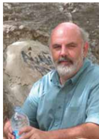
ilmsiksaanud ränka finantsolukorda, oleks Eesti euroalast väljajätmine saatnud avalikkusele

ajal sooviti Eesti vastuvõtmisega anda maailmale märku eurotsooni tugevusest. "Inimesed räägivad, et eurotsoon hakkab koost lagunema, aga vaadake, selle asemel me võtame hoopis uusi liikmeid vastu!" – just sellist sõnumit soovis Euroopa Komisjon edastada Eestit eurotsooni vastu võttes. Muide, enne tänava maikeus toimunud eurotsooni finantskriisi soovitas Euroopa Keskpanka nõukogu Eestit mitte vastu võtta – jätkusuutlikkuse puudumise tõttu. Arvestades Hispaania, Portugali, Iirimaa ja Kreeka