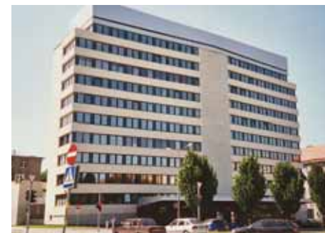
Valitsemishoone Tallinnas: varem EKP Keskkomitee, nüüd EV Välisministeerium.