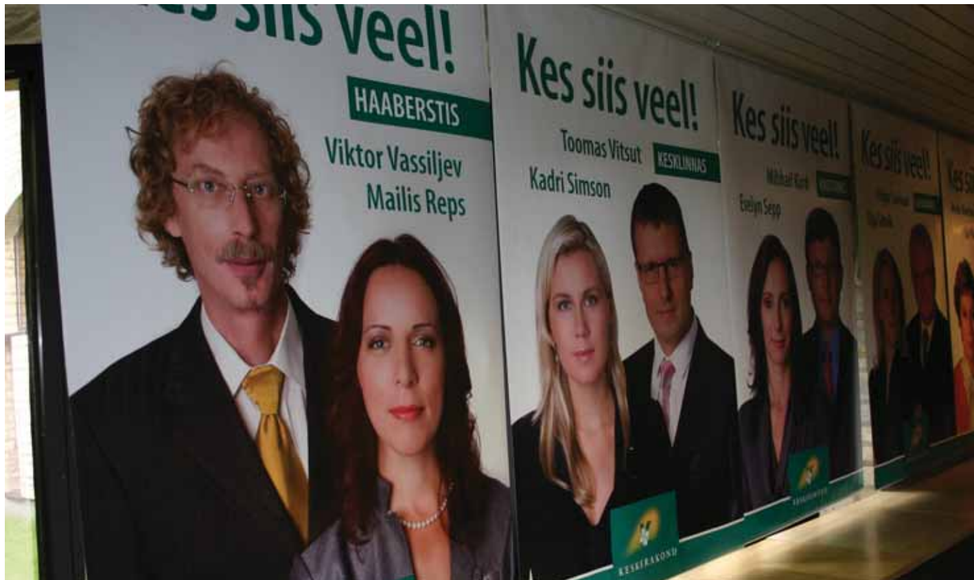
VALIMISKAMPAANIA: Kuigi inimesed sageli kurdavad, et „poliitike näod tüütavad kampaaniate ajal ära“, on see vaba demokraatliku ühiskonna loomuomane toimimisreegel. Kõik katsed kandidaatide suid sulgeda viitavad teiste jõudude domineerimissoovile.

Kuues põhjus, miks hääletada Keskerakonna poolt, on erakonna esimees Edgar