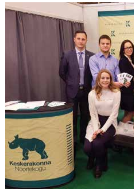
Noored poseerimas koos riigikogus vasakult esimene).