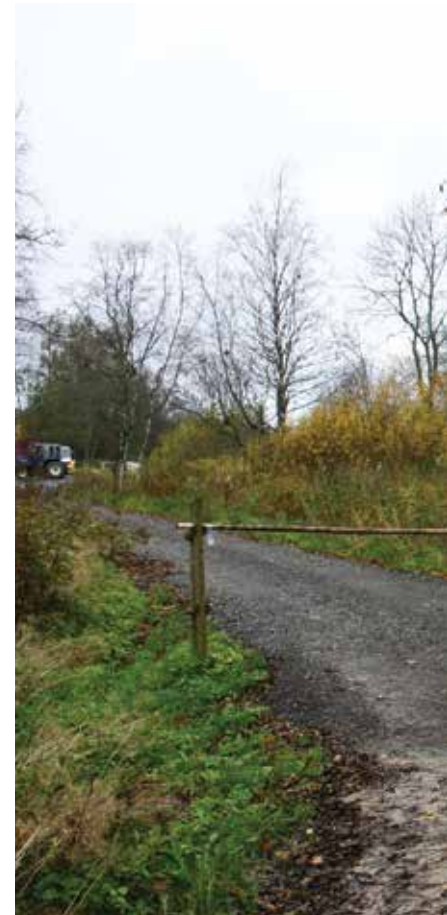
MAAD TULEB HOIDA: Eestlased isamaa. Meie õnn, et emakeelt pole müüa. Maa on muudetud ostu-müügi objektiks.

selle 25. aastapäeva puhul tähelepanuväärse ettekande „ Eesti rahvuslik ideoloogia ja MAA selle alusena “. Muu hulgas märgib Liidak järgmist: „ Meie ruumi on ikka ähvardatud – nii läänest kui idast... See sunnib meid ühtlasi alati teraselt valves olema, see ei lase meid