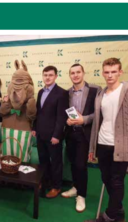
...lase Dmitri Dmitrijevi (seismas,

messi kontseptsiooni muutmise tänapäeva noorte soove ja huve täpsemini arvestavaks. „Tänavu seadsime eesmärgiks anda noortele terviklik ülevaade õppimis- ja karjäärivõimalustest, ühendades haridusvalikuid ja tegeliku tööelu, teha eriala valimine võimalikult selgeks ja teadlikuks,“ ütles Reedik. Kn