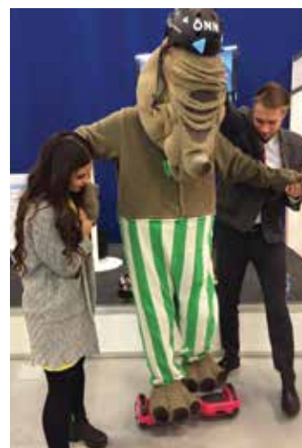
Vasakul: Lõbus noortekogu ninasarvik katsetamas poppi ja noortepärast tasakaaluliikurit. Paremal: Võim on sinu käes! Just see loosung meelitas huvilisi Keskerakonna Noortekogu boksi juurde.