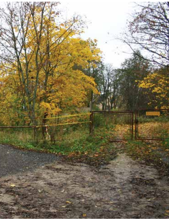
Maast on läbi aegade olnud pühad kaks sõna – emakeel ja jõud. Isamaaga on lood mõnevõrra erinevad. Objektiks, kusjuures peaesmärk on raha saamine.

Lõpetaksin siiski optimistlikumalt. Leian, et eesti rahvas on veel suuteline ise organiseeruma ning alustama uut võitlust iseseisvuse ja eestluse eest – oma MAA ja TALU eest. Mõned märgid on juba näha. Kasvõi Eestimaa Talupidajate Keskkonföderatsiooni maateemaline kongress Türi. Seejuures näen, et otsustavat rolli etendab siin meie ajaloos läbi proovitud seltsi- ja ühistegevus – seda nii poliitikas ja majanduses kui ka sotsiaalsel.