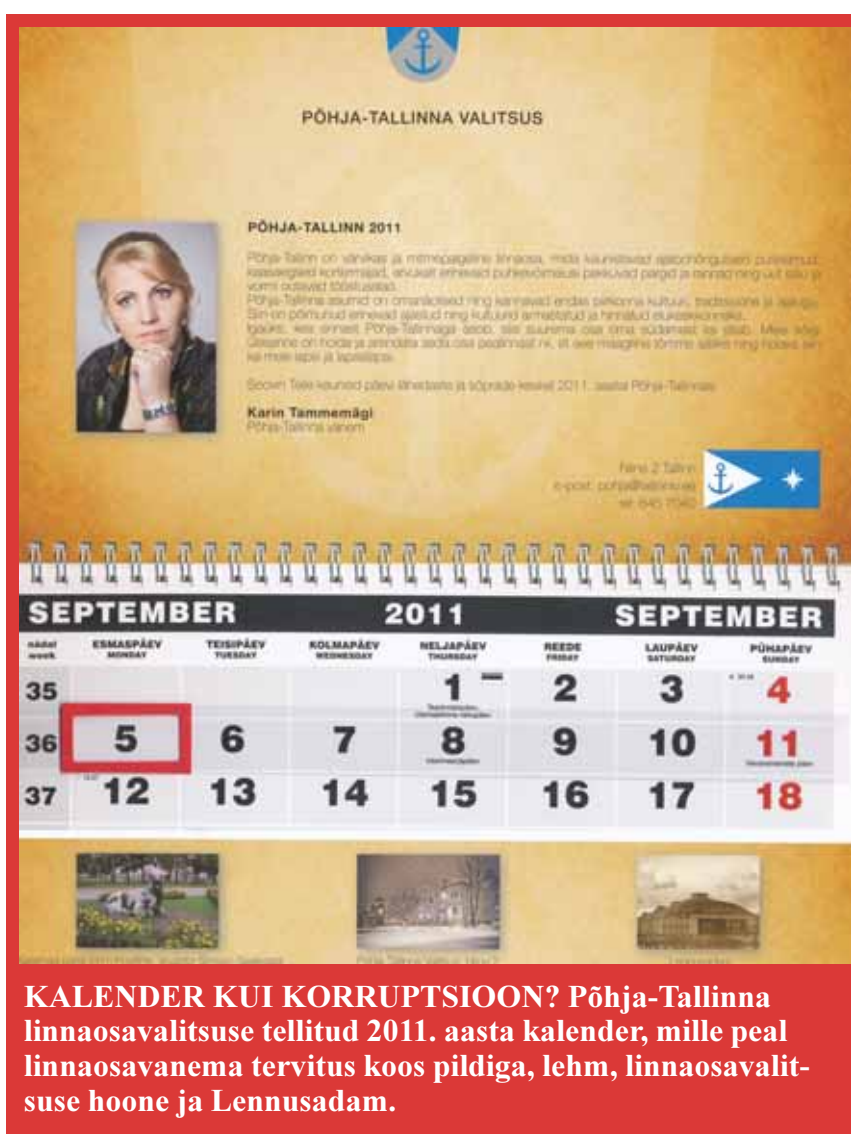
KALENDER KUI KORRUPTSIOON? Põhja-Tallinna linnaosavalitsuse tellitud 2011. aasta kalender, mille peal linnaosavanema tervitus koos pildiga, lehm, linnaosavalitsuse hoone ja Lennusadam.