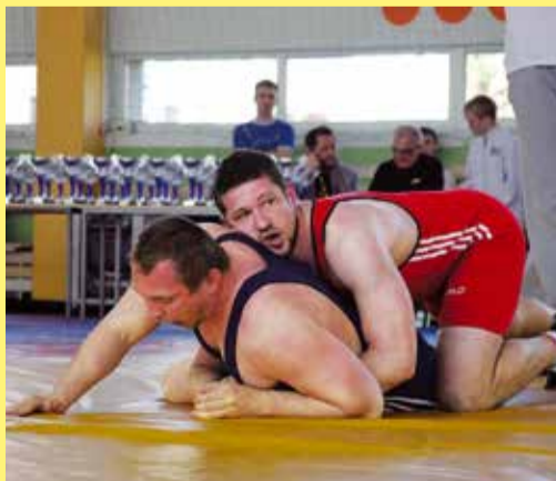
Nääme sai tänu oma aktiivsusele vastase parterisse.