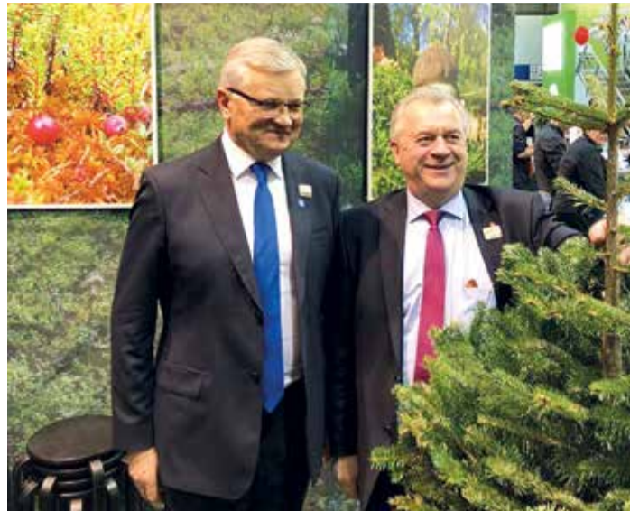
Tarmo Tamm osales 20. jaanuaril Saksamaal Berliinis põllumajandus- ja toidumessi Grüne Woche raames toimunud põllumajandusministrite konverentsil. Fotol Tarmo Tamm koos Rootsi maaeluministri Sven-Erik Buchtiga.

Paljud maapiirkondades elavad inimesed käivad tööl tömbekeskustes ja nende jaoks on oluline, et töökäimine oleks võimalikult mugav. Riigikantselei poolt 2015. aastal tellitud Ernst & Youngi teekasutustasu-