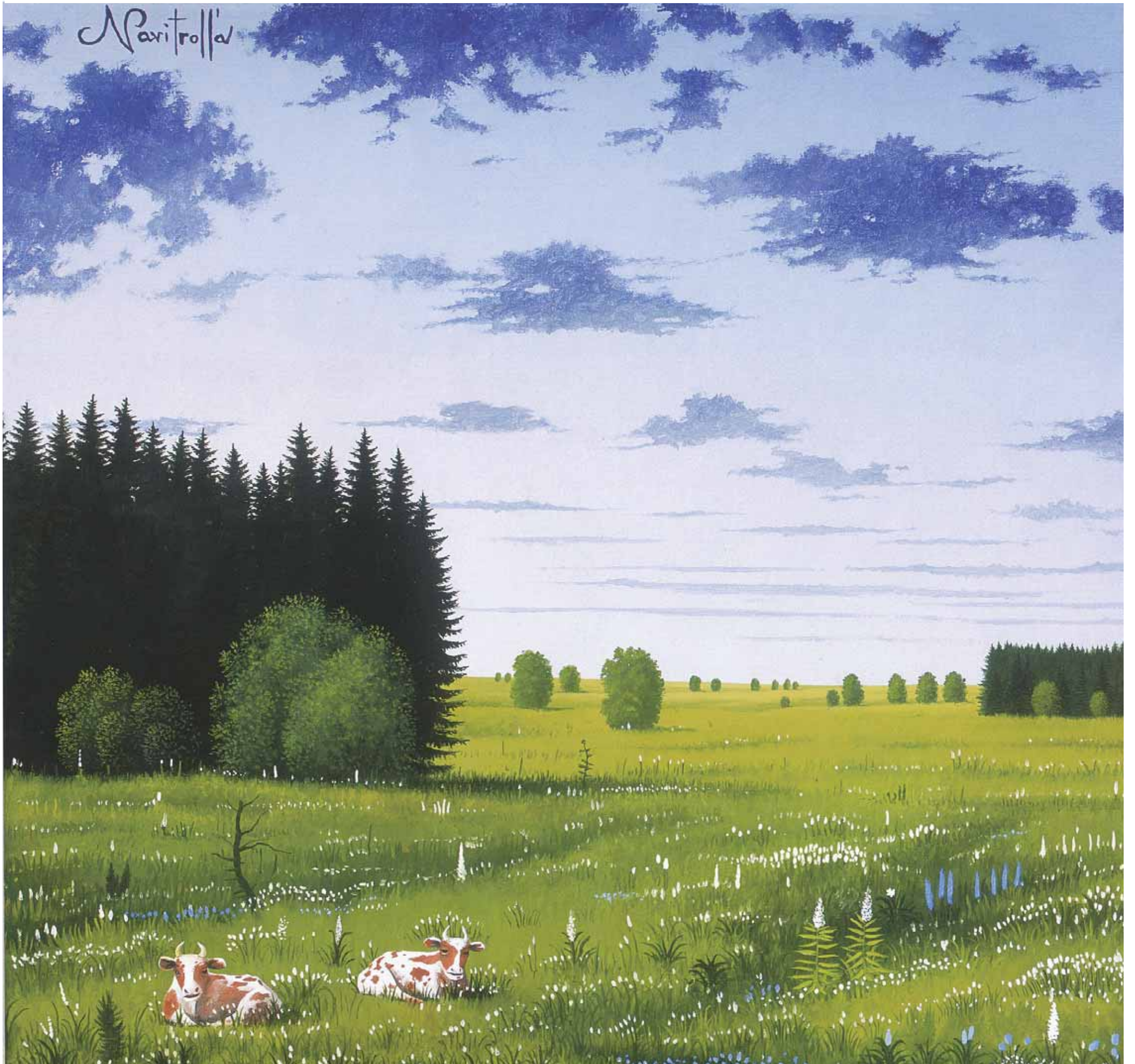
Sööme, puhkame ja anname piima. Navitrolla, 2005.