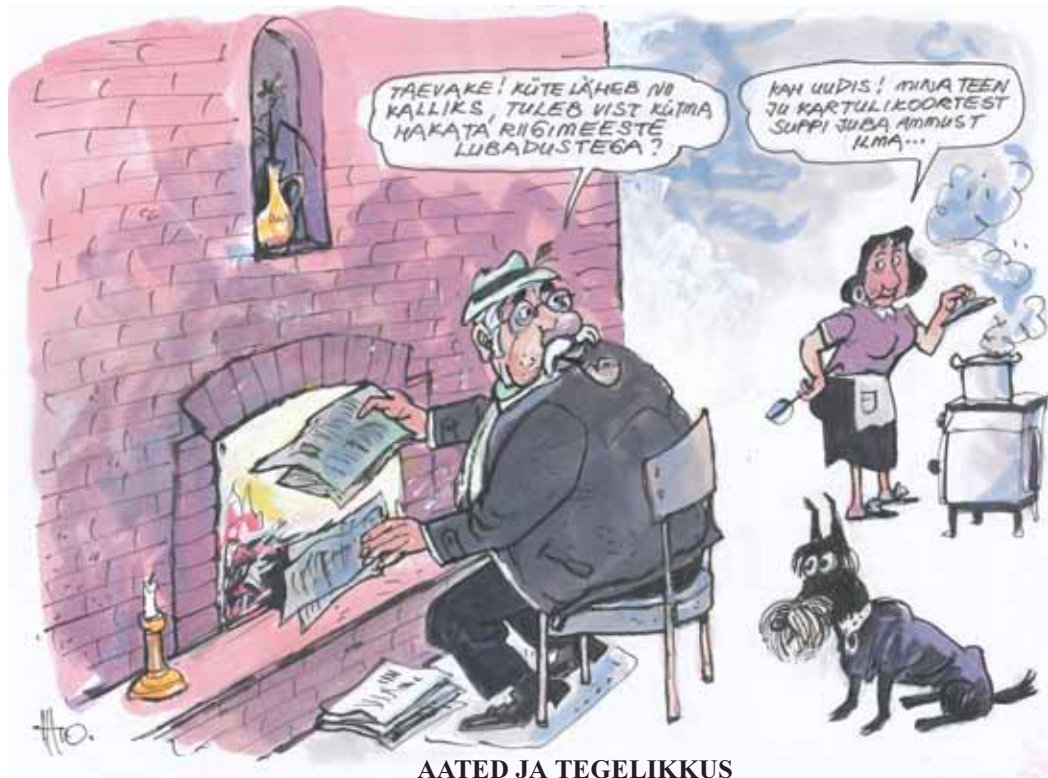
AATED JA TEGELIKKUS