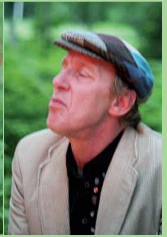
Näitlejatepaar Liina Tennosaar ja Egon Nuter.