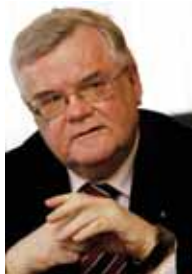
EDGAR SAVISAAR sõltumatu publitsist

Mäletan, kuidas euro tuleku eel kirjutas üks juhtivaid Eesti poliitikuid sellest, et ühine rahaühik euro teeb kõiki omavahel sõpradeks. Nüüd loen ajakirjast Bild ja mõnedest teistest väljaannetest, et sakslaste unistus on Kreeka võlgade katteks saada endale Rhodose saar (kus sageli veedavad suve saksa turistid) ning võib-olla isegi seada hüpoteek Akropolile. Eks niisuguseid kirjutisi lugedes tuleb kreeklastele meelde, kuidas Saksa sõdurid Teise maailmasõja ajal heiskasid Akropolile svastika. Sellised asjad ei lähe meelest ära, nagu enda käestki teame. Vastutasuks kannavad kreeklased oma meeleavaldustel mõnikord Merkeli pilte, kus Saksamaa kantslerile on ette joonistatud pisikesed vuntsid, mida ajaloo teatakse hoopis ühe teise saksa poliitiku ninaesiselt. Nii palju siis rahvaste sõprusest Euroliidus.