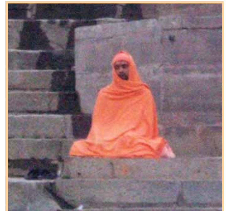
BUDIST: Tollel budistil, kes istus praktiliselt liikumatult Varanasi kaldapealsel kogu selle aja, mil pildistaja selles linnas viibis – üle nädala –, jooksevad küll kõik inimeste pisiintriigid mööda külge alla ega lähe talle korda.

Healuriikides, eriti Põhja-maades, on riik rahva kodu, kus kõigil on oma koht ja hea olla. Seepärast on seal vähem kiusamist ja torkimist kui meil (vrdl R. Taagepera EPL 5.04.2011). Vana-Hiina zenbudistid ja taostid leidsid, et sõnaline mõtlemine, mis põhineb vastandlike mõistetel, näeb vastuolusid ka seal, kus neid üldse pole. Tavainimene jagab terviku osadeks ja vastandab neid siis üksteisele; selle käigus puruneb harmooniline ühtsus ja inimene hakkab end võoran-