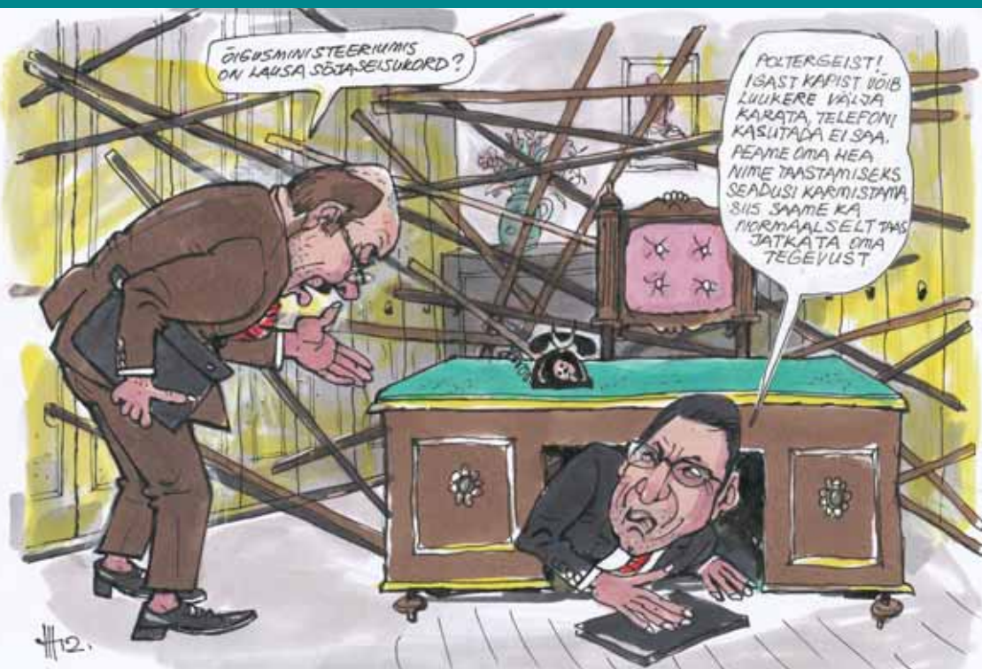
UMMIKSEIS EHK VÕITLUS RINDEJONETA