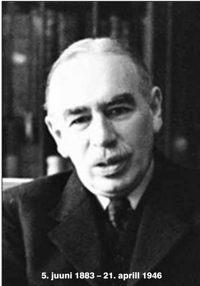
5. juuni 1883 – 21. aprill 1946

Keynesi teooria annab võimaluse taas mõtestada vaba turumajanduse ülistamisega ununema kippunud väärtusi, küsides: mis on mõistlik, mis on õiglane ja hea? See, mille vastu Keynes seis, oli valitsuse püüd eelarvet kärpida, ohverdades riigi võimet kriisist kiiremini väljuda. Keynes uskus, et suur tööpuudus ja sellele lahenduste mitte otsimine