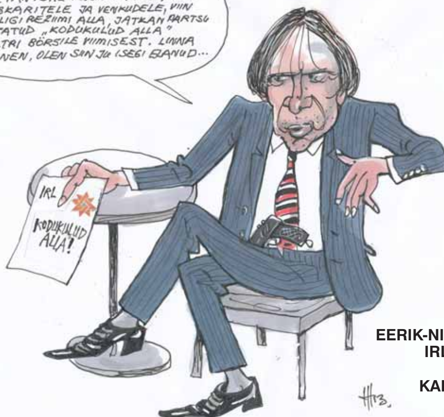
EERIK-NIILES KROSS IRL-i TALLINNA LINNAPEA- KANDIDAADIKS