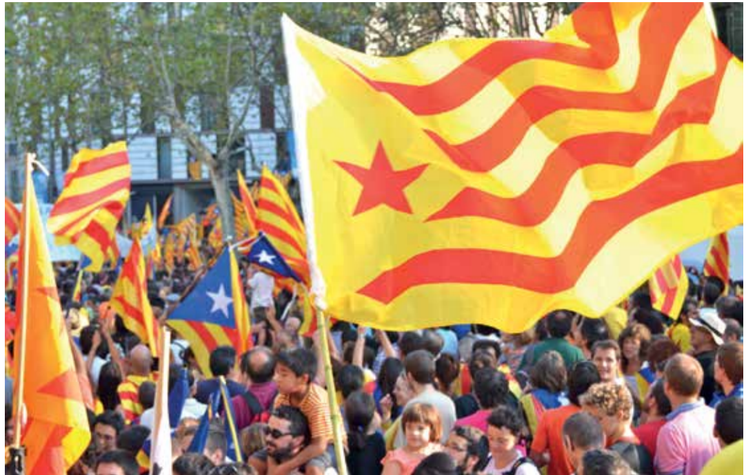
KATALOONIA ISESEISVUSLASTE LIPP. Üldlevinud arusaama kohaselt on katalaanid suurim riigita rahvas tänapäeva Euroopas.

Nii jõutigi lõpuks põhiseadusliku kriisini, mis kulmineerus nüüd iseseisvusreferendumiga, millega enam kui kaks miljonit inimest toetas Kataloonia