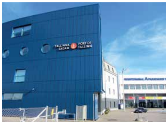
Tallinna Sadam kubises reformierakondlaste poliitilisest korrupsioonist, selgus ka Riigikogu erikomisjoni uuringu kokkuvõttest.

Loomulikult ei saanudki olla kuidagi teisiti, sest tegu oli Andrus Ansipi valitsuse justiitsministriga! Prokuratuuri töödandjaga.