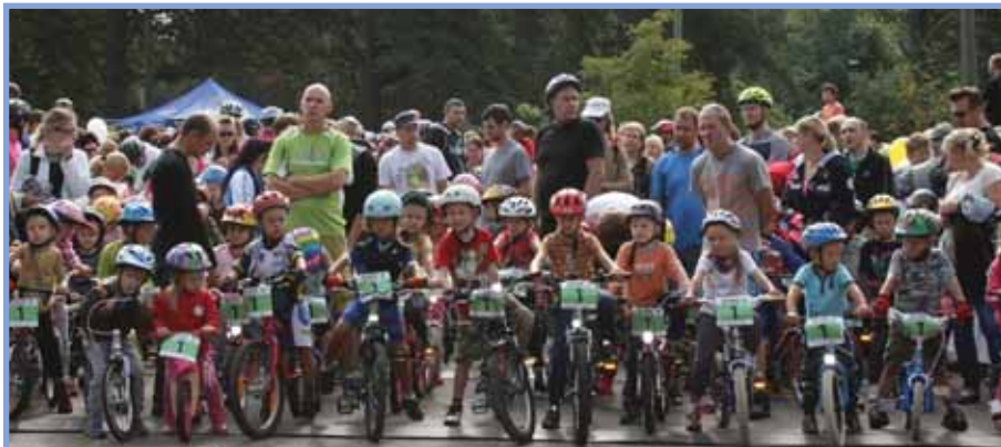
TULEVIKUTEGIJAD: Tilla- ja lastesõidus osales üle 300 lapse, kes kõik said väikese meene, diplomi ja medali.