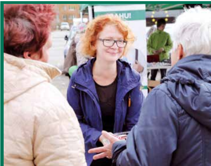
Yana Toom Euroopa Parlamendi valimiste eel Ahtmes tänavakampaaniat tegemas.

Kuna minu valimisplatvorm põhines eelkõige sotsiaalküsimustel, siin väga valiku-