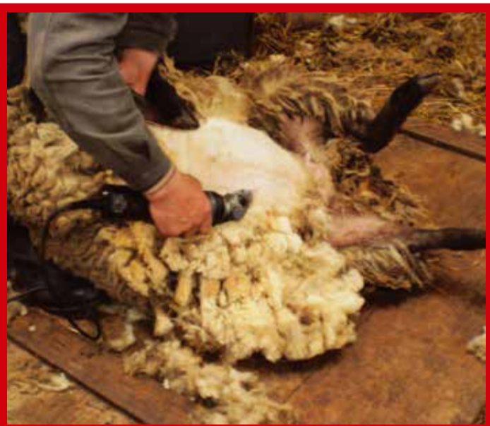
PÜGAMINE ON HEA: Vaid lammastunne end pärast pügamist paremini kui enne. Eestlased lasevad ennast pügada igat sorti liiakasuvõtjatel ja seadusandja saab selle eest vahekasu. Rahval aga – erinevalt lammastest – parem ei hakka.

sega kahest kuust kuni ühe aastani ja peale selle veel rahatrahviga mitte üle kolme tuhande krooni.