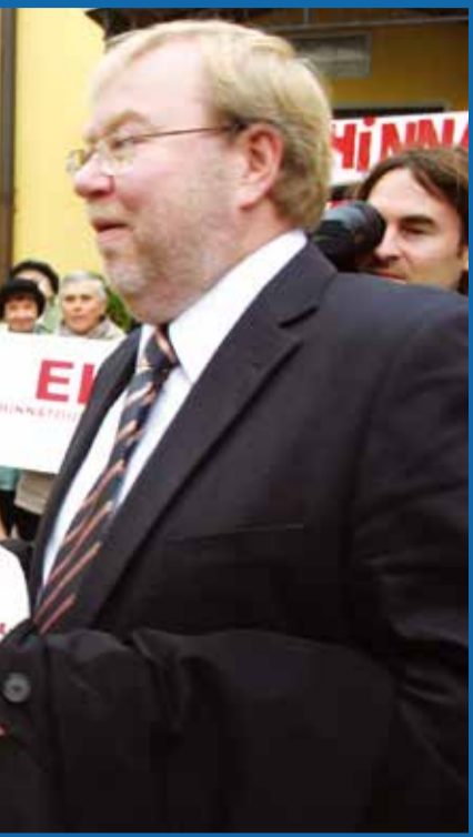
Idi, kus korrage on peale bril 2011 toimus Stenbocki e vastu, kus ka toonane me Lall ja Keski noortekogu u" pihku surusid.

na kriisis hukka sõjajõudude ja vägivalda kasutamise ning Krimmi annekteerimise. See on kõige tähtsam; muu on juba sisepoliitilise kommunikatsiooni