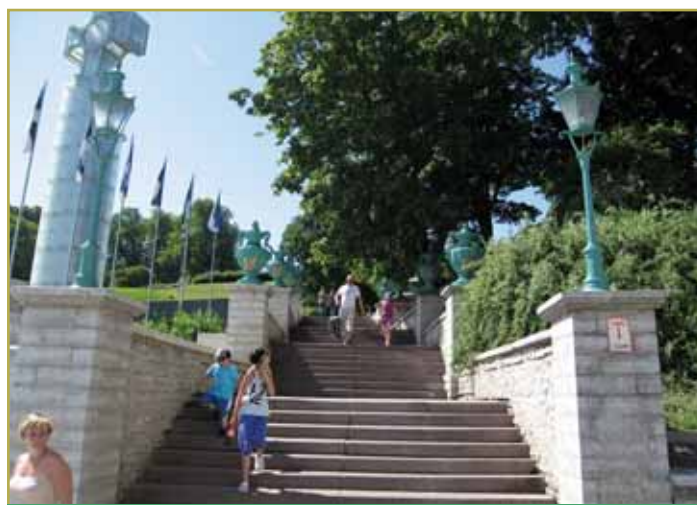
Mayeri trepp.

Isiklikult julgen arvata, et meie taasiseseisvumises võis üks