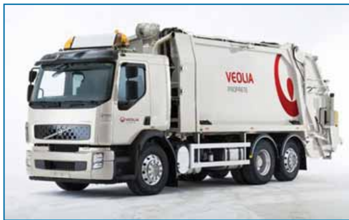
Prügiveedu käib Eestis globaalsel tasemel – Veolia on ülemaailmselt tegutsev kontsern.