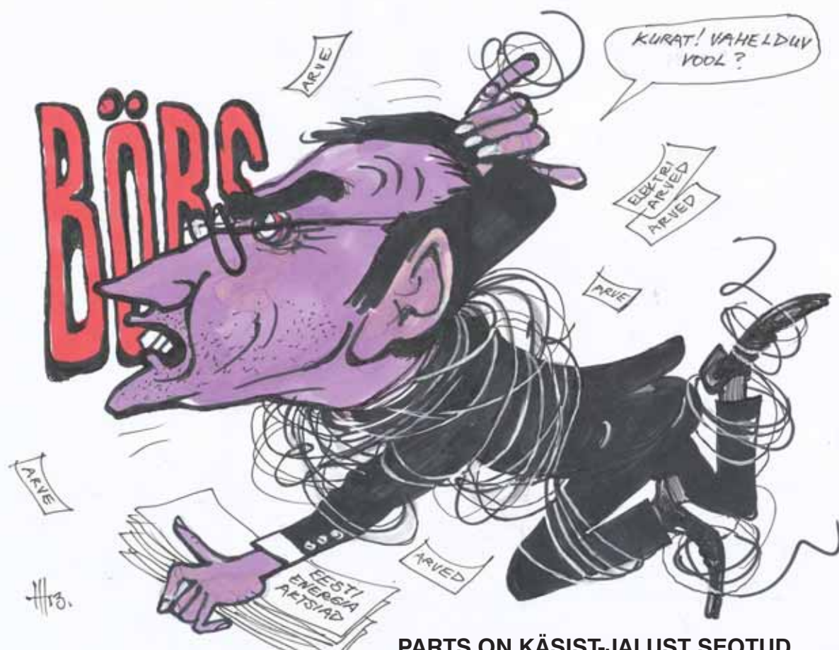
PARTS ON KÄSIST-JALUST SEOTUD