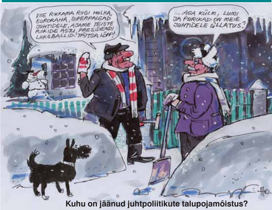
Kuhu on jäänud juhtpoliitikute talupojamõistus?