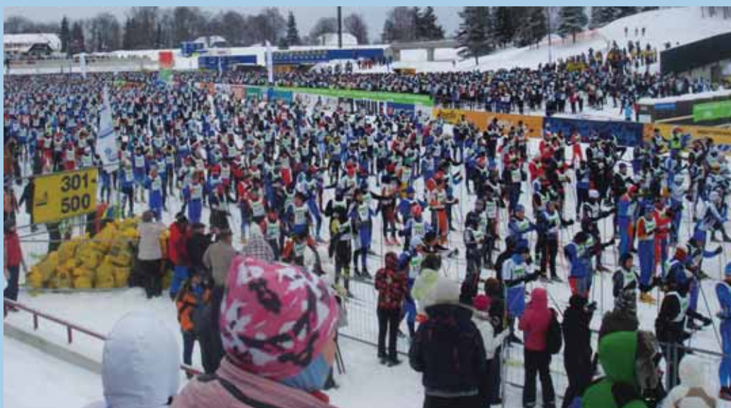
SUUSAPIDU: Tartu maratonil 21. veebruaril. 50 aastat kestnud traditsiooni jooksul on lõpetanud 110 000 rahvasportlast.

Nii võimsa tunde saamiseks on vaja kannatada kõigest 63 kilomeetrit. Ja emotsioon jääb püsima.