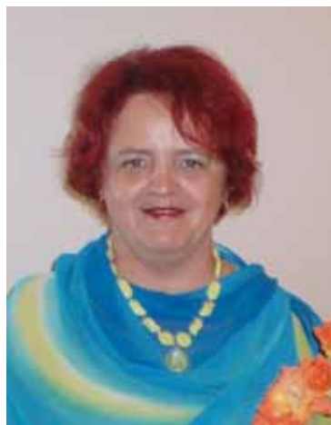
ÜLLE JUHT Valgamaa Arenduskeskuse juht Keskerakonna Valgamaa Naiskogu esinaine

Meil Eestis, kus naisi on poliitikas suhteliselt vähe, pole harv sellinegi küsimus: miks peaksid neid rohkem olema? On siis naistel mingi erilise missioon? Kas ajavad nad teistsugust poliitikat kui mehed? Kas naised muudavad poliitikat ja selle kaudu maailma kuidagi paremaks? Läheneva naistepäeva, 8. märtsi puhul võiksime selle üle arutleda.