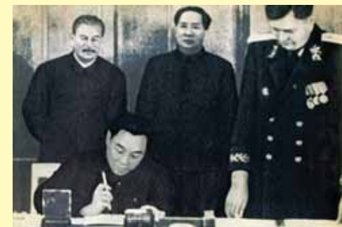
14.04.1950 - Hiina ja Nõukogude Liidu vastastikuse abi, sõpruse ja liidu leppe allkirjastamine.