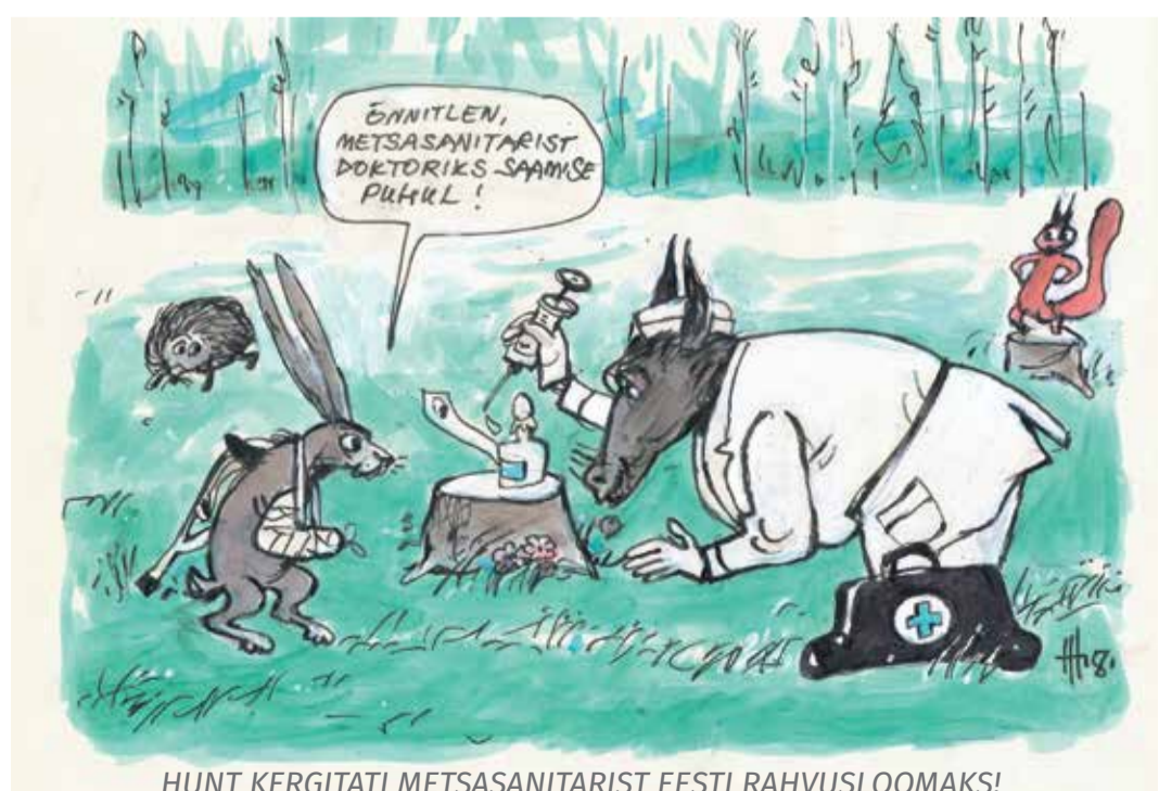
HUNT KERGITATI METSASANITARIST EESTI RAHVUSLOOMAKS!