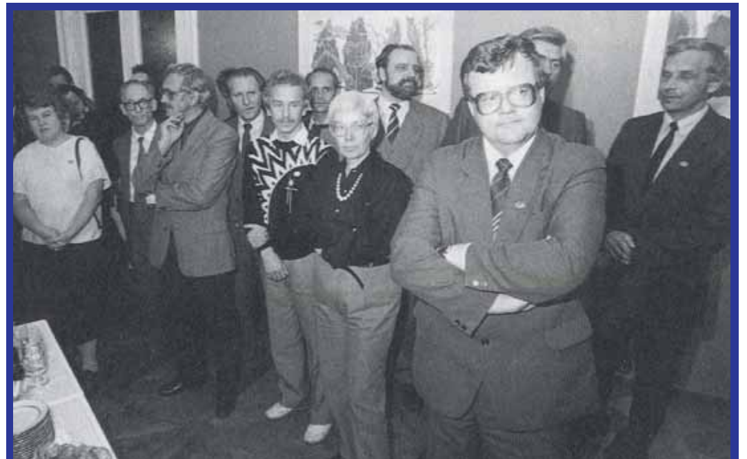
RAHVARINDE ALGATAJAD: Õnneks rahvas ei oodanud Reaganit ja asus moodustama Rahvarinnet, mis levis kulutulena 1988. a üle Eestimaa. Ajaloolisel pildil algatajad, esiplaanil Edgar Savisaar ja Marju Lauristin.

Küllap ma muidugi mäletan. Ma olin aktiivselt ettevõtluses. Kuid mäletan ka Edgar Savisaare rolli tollest ajast ja ma küll ei ületähtsustaks seda rolli. Pean kohatuks omistada Eesti rahva teeneid ainult ühele isikule. Jah, tal oli mingi roll, aga mitte liiga suur roll. Selge see, et Rahvarindel oli oma roll, oli ka toonastel Ülemnõukogu tegelastel, Arnold Rüütilil väga