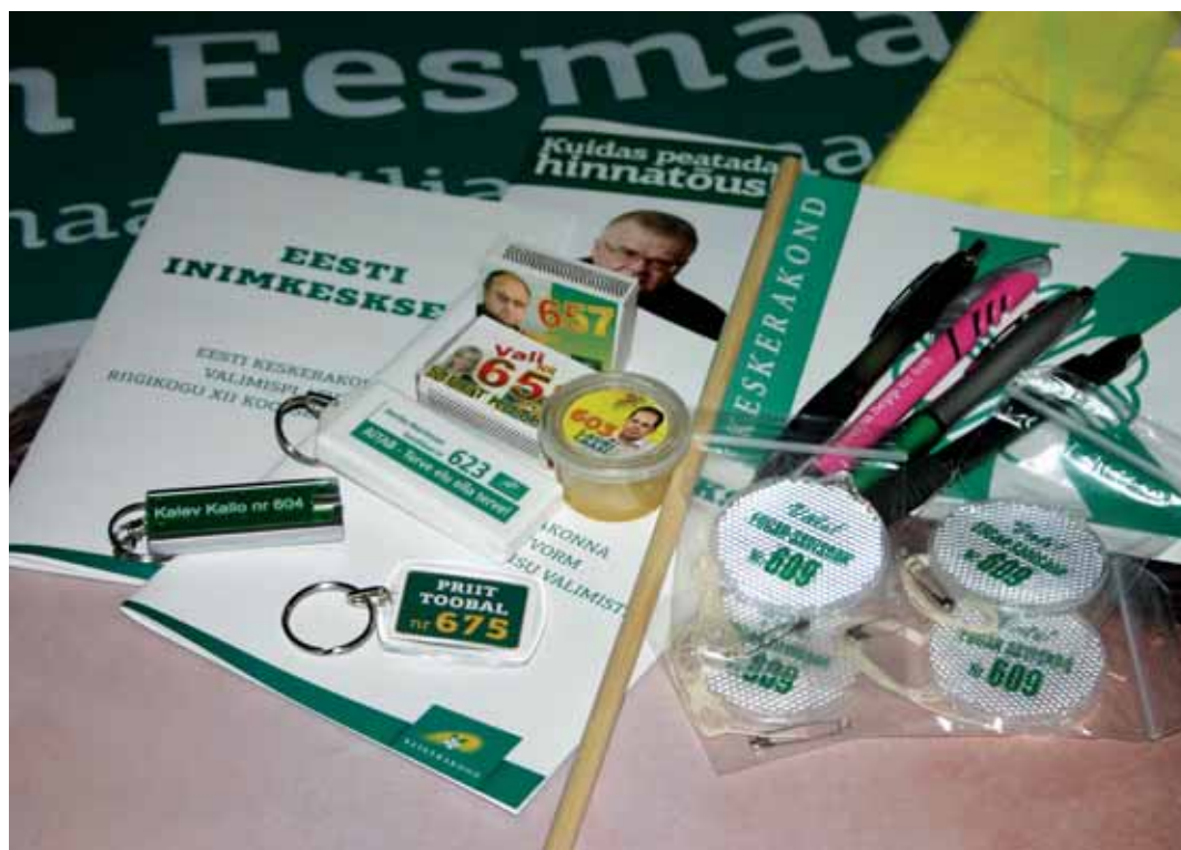
Valik Keskerakonna kandidaatide valimismeeneid.

Paljudes riikides (Prantsusmaal, Albaanias, Lätis, Poolas, Slovakkias) on manipuleerivate uuringute avaldamine valimiseelsetel perioodidel keelatud. Keskerakond saatis Vabariigi Valimiskomisjonile kirja, milles palub analüüsida valimisperioodil avalikustatud arvamusuuringute mõju valimistulemustele. Ausate valimiste läbiviimise eest vastutab Vabariigi Valimiskomisjon, ning nüüd ongi neil kohustus sellesse kahetsusväärse juhatusse sekkuda. Muidugi kui komisjoni ikka huvitavad ausad valimised.