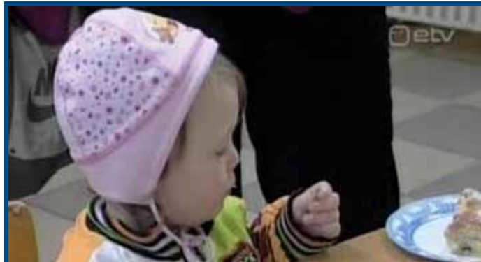
VAESUS: Kuni jätkub lapsi Eesti pealinna supikööki, püsib küsimus eestlaste elujõust. Kaader ETV uudisest 9. oktoobril 2009.