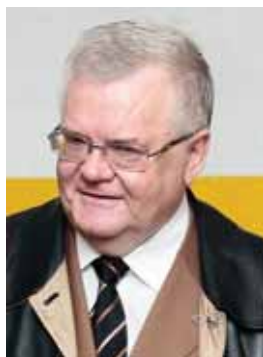
EDGAR SAVISAAR Keskerakonna esimees

Andrus Ansip kuulutas tänavuses vabariigi aastapäeva kõnes Tartus, et tema juhitud Eesti on imetlusväärne stabiilsuse saar keset mäslavat maailmamerd.