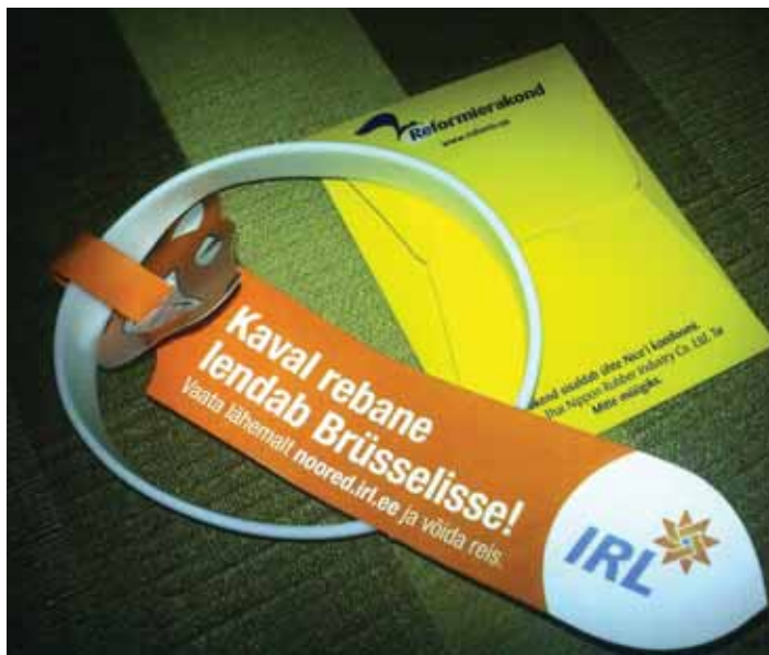
AJUPESU: Kõrgharidusõppesse sisseastujatele mõeldud rebasekott oli pungil täis valitsuserakondade propagandat.

“Seni end avalikult apoliitiliseks ühenduseks nimetanud katusorganisatsioon, kes varjatult on kogu aeg paremerakondadele promo teinud, on nüüd, enne valimisi ilmselt kannatuse kaotanud ja asunud