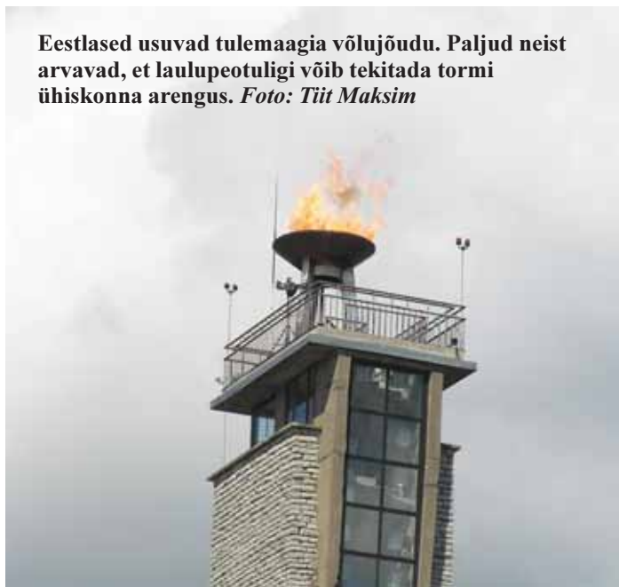
Eestlased usuvad tulemaagia võlujõudu. Paljud neist arvavad, et laulupeotuligi võib tekitada tormi ühiskonna arengus.

Teistes liiduvabariikides (välja arvatud Läti) polnud ju rahvastiku koosseis selline, mis tekitanuks olulisi probleeme nende iseseisvumiseks. Polnud neis ka endistel punanomenklatuurlastel ja varasemat õiguslikku järjepidevust esindavatel rühmitustel sellist alust võitluseks võimule jäämise