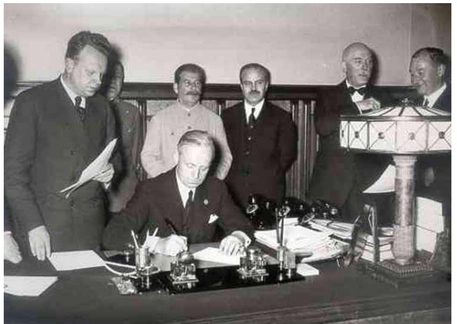
LEPING: 23. augustil 1939 allkirjastasid Saksamaa ja Nõukogude Liidu välisminister Ribbentrop ja Molotov Moskvas mittekallaletungipakti ja selle juurde kuuluvad salaprotokollid. Arhiivifoto

Osalejaid riike oli palju. Igaühel neist on omad arhiivid, oma tõlgendus ja oma ajalookäsitlus. Kuid ikka mindi Euroopa rahu tagama, „halbu“ valitsusi karistama, oma rahvuskaaslasti kaitsma, teiste riikide rahvaid päästma jne