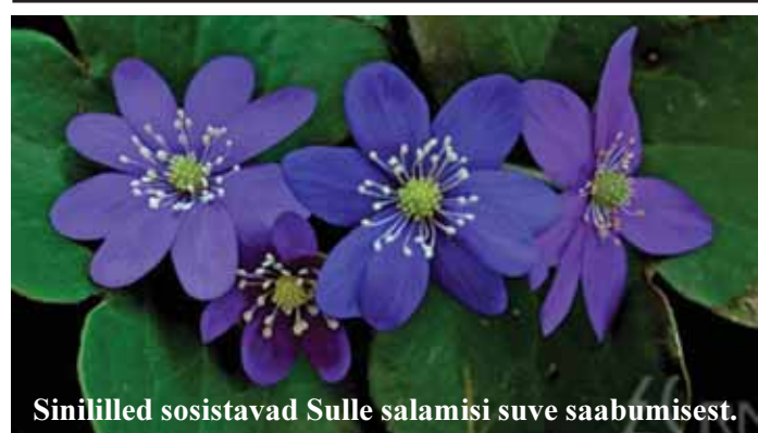
Sinililled sosistavad Sulle salamisi suve saabumisest.

Hillar Kohv Viinahaualt, Tori vald, Pärnumaa