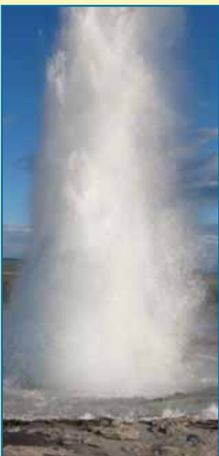
Islandi looduse ilu.

Sotsiaaldemokraadid, kes tüürisid Islandit läbi kriisiga aastate Euroliidu liikmelisuse suunas, said parlamendivalimistel lüüa. Sotsid pälvisid äsjastel valimistel kõigest 12,9% häältest, samas kui 2009. aastal teeniti ära 29,8-protsendine toetus.