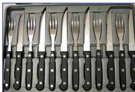
Noad-kahvlid nagu ärireeks Kippelil Oskar Lutsu „Tootsi pulmast“ - otse Engelsvärgilt?..

Tallinnas käivad ringi „kaupmehed“, kes pakuvad köögi-riistu „soodsate“ hindadega. Nädal tagasi ilmus üks selline minu elukohta Harjumaal, Tallinna piiril. Meenus lapsepõlv, kui 1950. aastatel käisid meie talus hobustega kaltsukaupmehed, kes pakkusid kööginõusid, ja mäletan, et ema sai kaltsude vastu alati plekk-kaasi (tollal defitsiitne kaup), mida kasutasime hoidisepurkide sulgemiseks. Nüüdne „kaupmees“ pakkus mulle suurde nahkkohvrise pandud seitset keedupotti. Need olid suuruses 1–8,5 liitrit. Kaasas oli ka Saksamaal asuva valmistajatehase dokumentatsioon ja sinna juurde kuuluv reklaam koos hinnakirjaga. Potid olid üüratult kallid. „Kaupmees“ aga pakkus supipotte tegelikult hinnast 75% odavamalt, küsides kauba eest (koos kohvriga) 500 eurot. See-