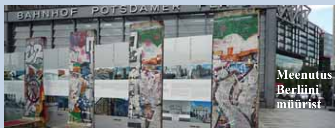
Meenutus Berliini müürist

Aga mitte kauaks – kohe hakati propageerima Euroopa Liitu astumist. Mõned küll laitsid: ühest Liidust saime vabaks, nüüd kohe kiiruga teise... Seepeale kuulsime Euroopast koolipapalikkust, et Eestil kodutööd hirmus hästi tehtud, ja meile