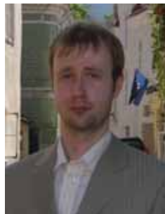
VIRGO KRUVE MTÜ Eurosaadik

Tublisti üle poole (59%) Eesti peretoetustest saavad OECD analüüsi järgi viide rikkamasse tuludetsiili kuuluvad. Seega läheb toetus rikkastele, kes seda niiväga ei vajakski. EPL-is käidi välja mõte, et vanemapalka maksmiseks kuluv raha võiks tulla inimeste enda rahakotist kindlustusmaks vormis (nagu töötuskindlustus) ja eraldada see riigieelarvest.